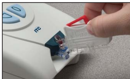
2. Anexión a Tenderlett® Plus