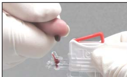
1. Recogida de muestra